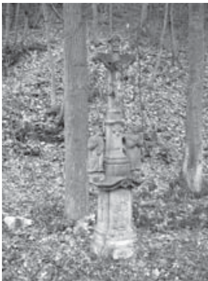
Pískovcová socha Kalvárie ve Svařeňi, pol. 19. stol.