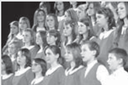
DPS Rubínek.

Smíšený pěvecký sbor Otakar a Základní umělecká škola Vysoké Mýto pořádají