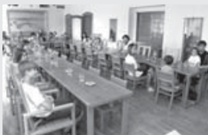
Setkání s výherci soutěže „Vytřídit nápojový karton se vyplácí“ na radnici