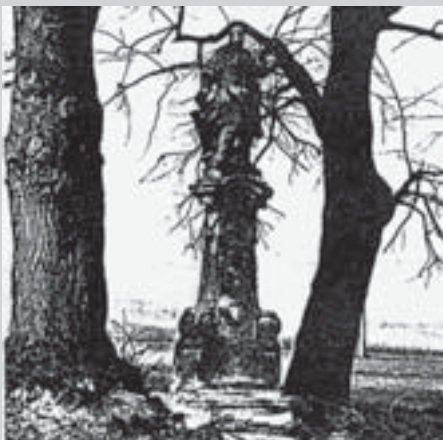
Svatý Vavřinec na svém místě na knířovské cestě v 60. letech 20. stol.

Pacáka. Dnes je velmi poškozená socha v jednotlivých segmentech uložena na knířovské faře a připraveno je její restaurování. Na své původní místo zhruba v polovině knířovské poutní cesty se však asi sotva vrátí. Místem, kde stávala, povede dálnice R35. O jejím eventuálním přemístění na jiné místo se tedy bude muset ve spolupráci Ministerstva kultury, města Vysoké Mýto, projektanta dálnice, památkářů a římskokatolické farnosti v dohledné době jednat. Socha byla poničena v době neblahého působení sovětské armády v této lokalitě; restaurátorský zásah bude znesnadněn tím, že světci chybí hlava, obě ruce od předloktí a všechny zlacené atributy (svatozář a palmová ratolest). Naštěstí bude restaurátorům k dispozici poměrně dobrá fotodokumentace z počátku 60. let, kdy byla socha ještě ve velmi dobrém stavu.