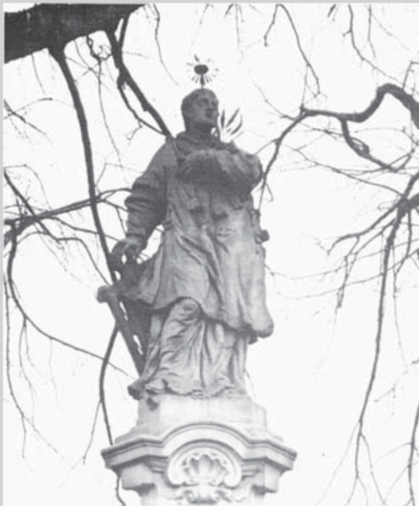
Svatý Vavřinec (stav v 60. letech 20. stol.)