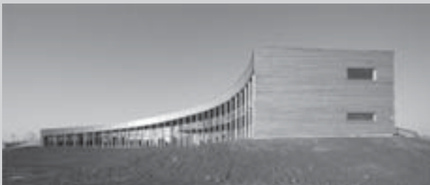
Sluňákov, novostavba budovy, 2006

Centrum mělo sloužit hlavně pro výuku dětí – jako zcela ojedinělá škola v přírodě. Součástí tohoto projektu byla i budova vzdělávacího centra. Ředitel se však rozhodl pro tuto budovu vypsat výběrové řízení a oslovil několik architektonických ateliérů. Zadaním bylo navrhnout objekt pro výuku a rozhodnu, ze které by byl park přehlédnutelný. My jsme předložili návrh zasypaného domu na jehož střechu – vrchol kopce můžete vyjít a máte celý park jako na dlani. Tuto soutěž jsme vyhráli hlavně proto, že náš návrh byl citlivě zasazen do parku a svou severní uzavřenou stranou – kopcem – se stal jeho součástí. Na jižní stranu, tedy směrem ke slunci, je objekt otevřen. Zakřivení jižní fasády vytváří jakési zelené nádvoří, které je odděleno od sousední zástavby umělým valem. Více na www.slunakov.cz .