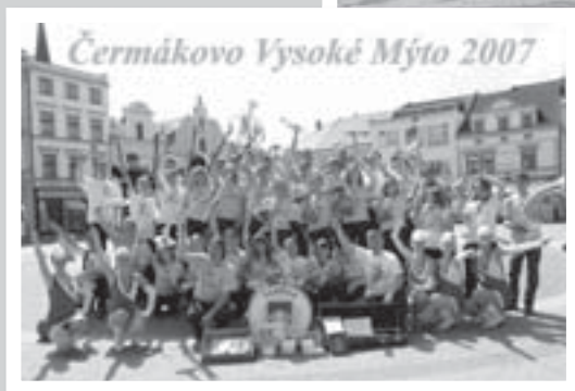
Vítěz XV. ročníku ČVM DO ZUŠ Zábřeh