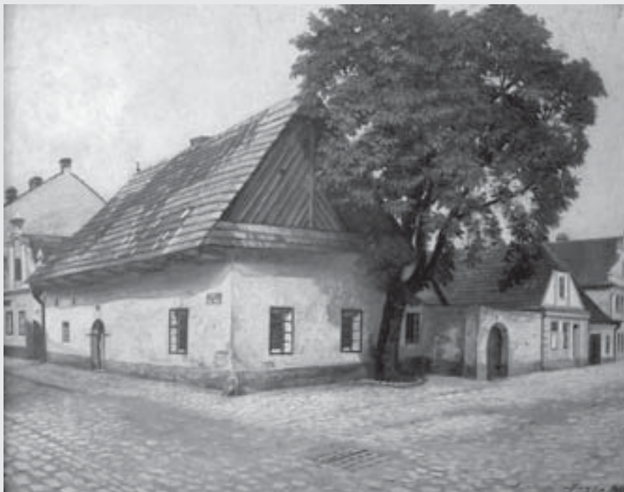
Stará škola na Kostelním náměstí (dnes Penzion Tošovský), 1910, olej, karton, Regionální muzeum ve Vysokém Mýtě