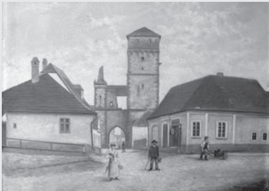
Václav Prágr: Pražská brána z roku 1872 , 1912, olej, karton, Regionální muzeum ve Vysokém Mýtě