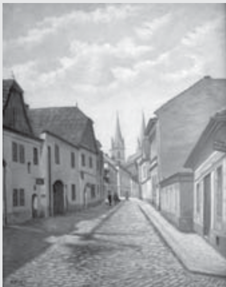
Ulička u Smékalova pekařství, 1912, olej, karton

Václav Prágr se narodil, vyučil a oženil v Luži, ale už v roce 1876 se spolu s novomanželkou Annou (roz. Pýchovou) přestěhoval do Vysokého Mýta, kde mu bylo v roce 1902 uděleno i domovské právo (bydlel v domě 159 ve Foerstrově ulici - vedle fary). Svým prvním povoláním byl Václav Prágr malířem pokojů (a tuto živnost provozoval ve Vysokém Mýtě vlastně po celý život), kromě toho byl ale i amatérským malířem. Malováním obrázků si přivydělával zejména v letech 1899-1918. Z této doby se zachovala řada obrazů, vedut Vysokého Mýta, jak panoramat (z nichž to nejznámější reprodukuje na obálce), tak zobrazení dnes mnohdy již neexistujících domů z historického jádra Vysokého Mýta a jeho okolí. Přestože samouk, dopracoval se osobitého, precizně realistického stylu. Známé jsou především jeho oleje na plátně, které dodnes vynikají kvalitou malířské techniky i velmi věrným zachycením dobové architektury. Proto mají výraznou dokumentární hodnotu a jako takové jsou, vedle dobových pohlednic, nejvěrnějším svědectvím o vzhledu Vysokého