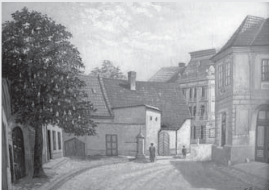
Hotel Tejnora , 1916, olej, karton, Regionální muzeum ve Vysokém Mýtě