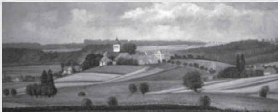
Knířov, 1917, olej, karton, 30 x 70 cm, značeno dole uprostřed V. P. 1917, soukromá sbírka, Vysoké Mýto

Mýta na přelomu 19. a 20. století. Na třicet Prágrových prací vlastní Regionální muzeum ve Vysokém Mýtě, jeden mimořádný, neboť figurální olej pak Městská galerie (byl publikován ve Zpravodaji 4/2007), jeho největší olej, velké panorama Vysokého Mýta pak od dávných dob visí na schodišti Základní školy Javornického. Velké množství Prágrových prací je dodnes i v soukromých rukou.