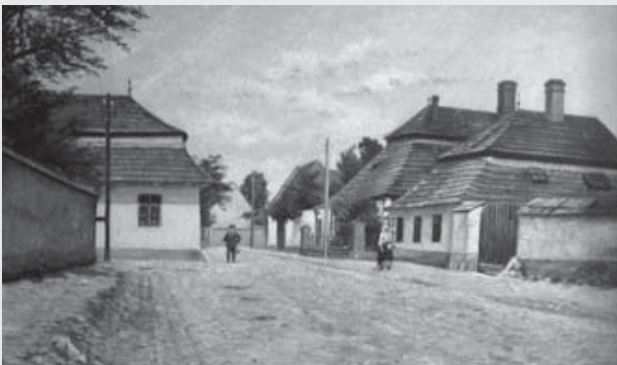
Na Prasečím rynku (dnes autobusové nádraží), 1910, olej, karton, Regionální muzeum ve Vysokém Mýtě