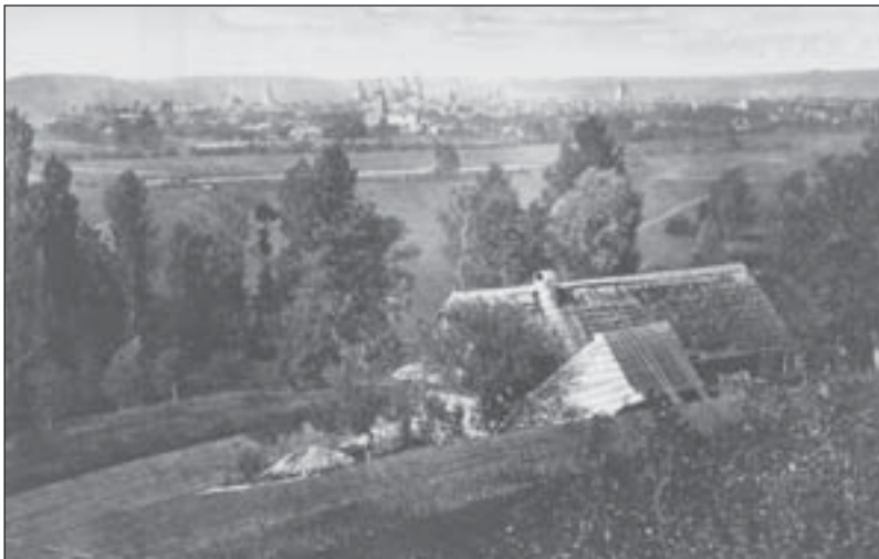
Pohled na panorama Vysokého Mýta od Vinic Fotografie z doby kolem roku 1860.