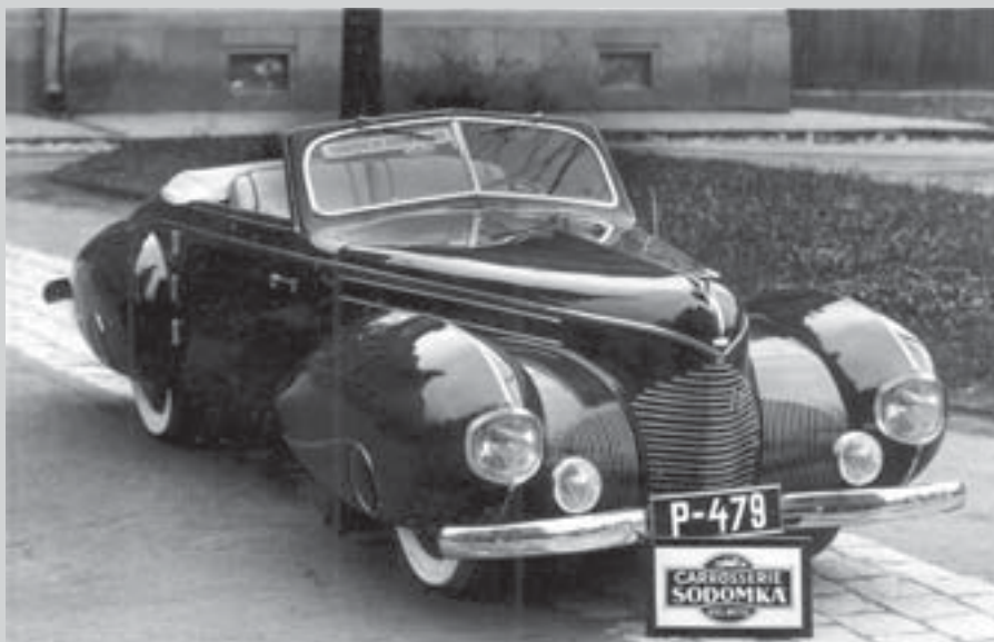
Aero 50 Dynamik vyrobený v Sodomkově karosárně pro syna majitele továrny Aero Vladimíra Kabeše k jeho 21. narozeninám.