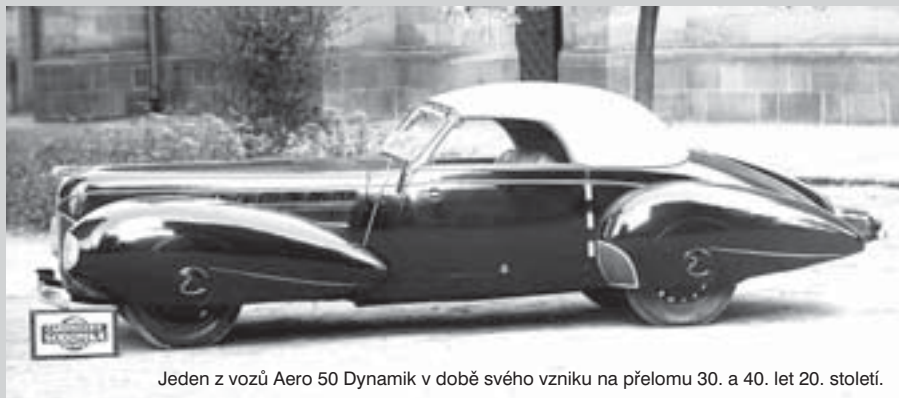
Jeden z vozů Aero 50 Dynamik v době svého vzniku na přelomu 30. a 40. let 20. století.

Dodnes se dochovaly pouhé dva exempláře. První z nich byl na počátku 80. let svérázným způsobem opraven ve Spojených státech amerických a dnes patří ke slavné kalifornské sbírce Blackhawk Collection v Danville (tomuto dnes červenobílému modelu se proto také říká Arizona). Vrak druhého vozu získalo před třemi lety Regionální muzeum ve Vysokém Mýtě, které jej dalo zrenovat. Slavnostně se legendární kabriolet představí veřejnosti v rámci II. ročníku festivalu Sodomkovo Vysoké Mýto 7. června 2008.