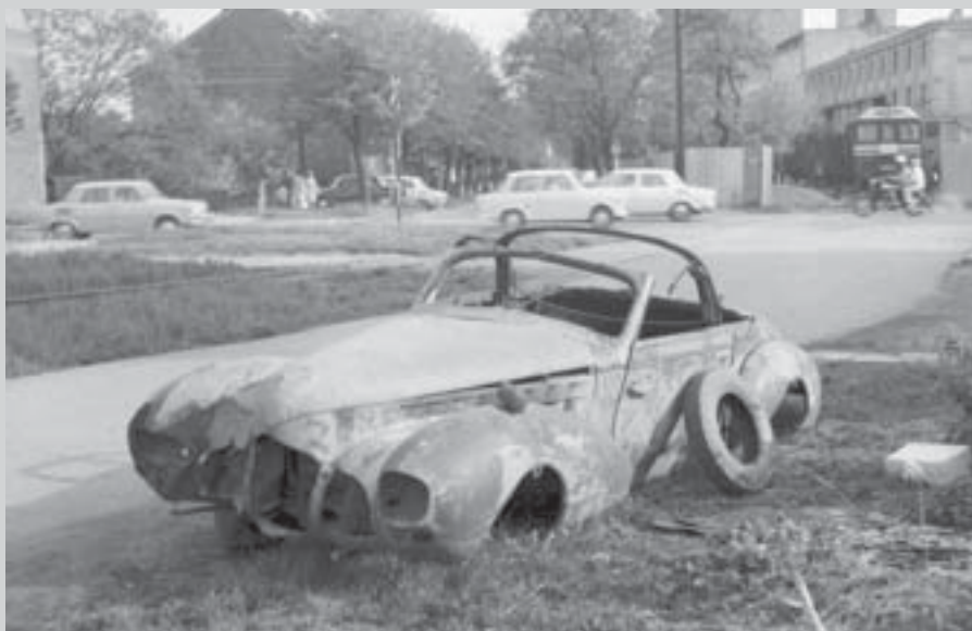
Vrak Dynamiku v 70. letech v Olomouci.

Text dnešní Vitrianky vznikl na základě informací z právě vydávané knihy Automobily Aero s karoseriemi Sodomka , kterou připravilo a vydává Regionální muzeum ve Vysokém Mýtě.