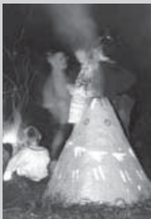
Výpal v papírové peci

Vernisáž se koná v úterý 17. června v 17.00 v galerii Kubík. Součástí vernisáže bude i představení hry Stvoření světa podle Effela v podání Divadla Arlekin z polské Lodže (Smetanův dům, 18.30). Vstupenky na toto představení, které vzniklo v česko-polské spolupráci, budou současně i pozvánkou na vernisáž.. Je možné je zakoupit v Informačním centru Městského úřadu od 3. června. Vstupné 100 a 50 Kč.