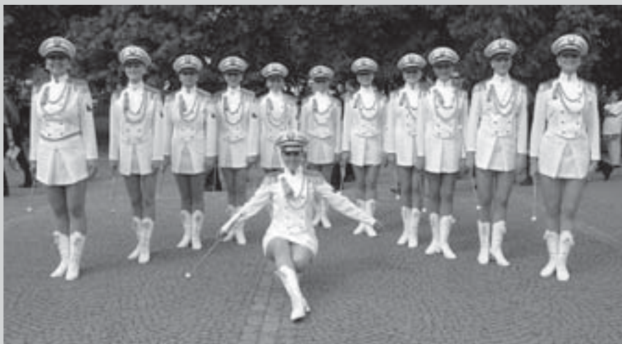
Mažoretky Rytmus Ostrava - ČVM 2006

Po skončení přehlídky bude následovat samostatný koncert Tanečního orchestru ZUŠ CHRUDIM .