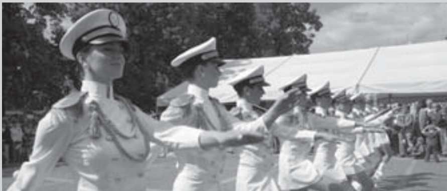
Mažoretky Rytmus Ostrava - ČVM 2006

20.00 - koncert skupiny READY KIRKEN na náměstí Přemysla Otakara II.