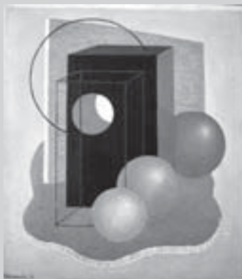
2. Ostrov lásky, 1932, olej, plátno, 64 x 57 cm.