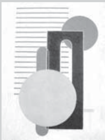
3. Geometrická kompozice, 30. léta, olej, plátno, 45 x 33 cm