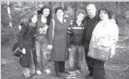
Vedoucí zahraničních mládežnických skupin v programu Mládež v akci.

13. - 20. 5. PĚTISTRANÁ VÝMĚNA MLÁDEŽE ve Vranicích u Litomyšle. Zúčastní se jí zástupci Litvy, Lotyšska, Slovenska, Polska a samozřej- mě České republiky.