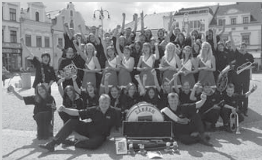
Vítěz XIV. ročníku ČVM 2006 - DO ZUŠ Zábřeh

Projekt se koná za finanční podpory Ministerstva kultury ČR a Pardubického kraje.