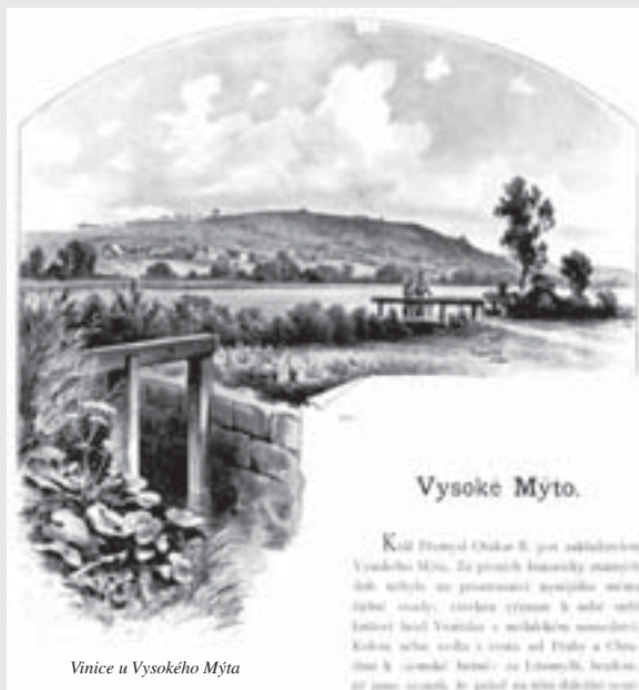
Vinec u Vysokého Mýta

V této rubrice vám každý měsíc představujeme jedno literární, historické nebo umělecké dílo s vysokomýtskou tematikou. Rubrika vzniká ve spolupráci Městské galerie, Městské knihovny a Regionálního muzea ve Vysokém Mýtu a připravuje ji dr. Pavel Chalupa.