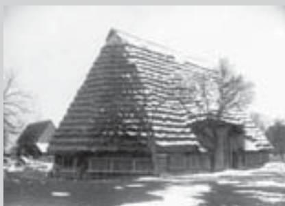
Polygonální stodola ve Srubech (začátek 20. století)

DŘEVO, HLÍNA, OPUKA lidové stavitelství na Vysokomýtsku