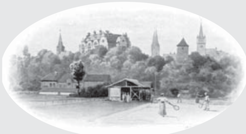
Nová tělocvična Sokola ve Vysokém Mýtě