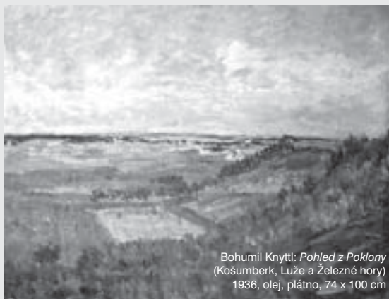
Bohumil Knyttl: Pohled z Poklony (Košumberk, Luže a Železné hory) 1936, olej, plátno, 74 x 100 cm

26. března byla ve Výtavní síni Jana Jušky zahájena výstava Bohumila Knyttla. Bohumil Knyttl patřil ve 30. a 40. letech 20. století k velmi úspěšným malířům, potulným plenérním solitérům typu Jana Honsy. I Knyttl pocházel ze statku, k přírodě a krajině měl tedy, podobně jako Honsa, vztah nezatížený romantickou nostalgií. Ve 30. letech pracoval jako restaurátor při opravách fresek a obrazů na zámku v Nových Hradech a v roce 1936 se ve Střemošicích seznámil se svou bu-