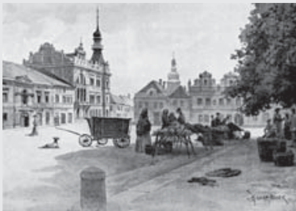
Nový okresní dům ve Vysokém Mýtě