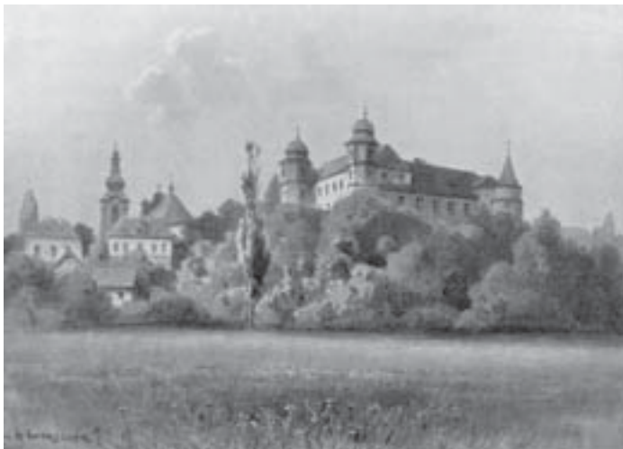
Zámek v Zámrsku, lavírovaná kresba Karla Liebschera, 1905.