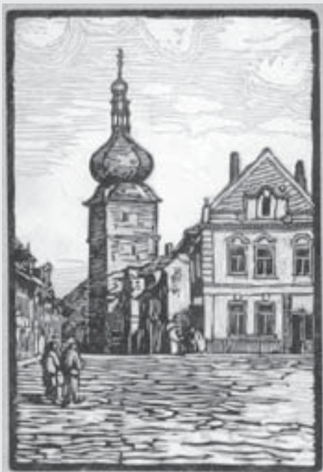
Alois Srnský: Chocceňská věž ve Vysokém Mýtě (pohled z náměstí). Dvoubarevný dřevoryt, kolem 1930, 15 x 11 cm, tištěno jako originální grafická příloha knihy Vysokomýtsko , 1931

dvojitém kruhu kolem Mariánské sochy. Během doby vyskytlo se několik projektů k další úpravě náměstí. Bylo například navrhováno, aby náměstí vůbec bylo proměněno v park a kolem domů vysázeny stromy. Proti tomu namítáno, že právě z důvodů historických a vzhledem k hospodářskému určení náměstí nelze tohoto návrhu schválit, neboť středověké náměstí bylo určeno „obecnému lidu k handlům všelijakým a trhům, zemanům pak k turnajům, honbám a kolbám, menstruňkům a jiným rytířským činům“. Na náměstí se soustřeďoval veškerý obchodní i občanský ruch. Toto určení má náměstí ještě dnes. Zde se konají přívál chodců i povozů, konají se výroční trhy, veřejná shromáždění lidu, slavnosti a j.